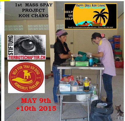
Bericht in der deutschsprachigen Zeitung in Thailand: http://www.wochenblitz.com/nachrichten/pattaya/63669-massensterilisation-auf-koh-chang.html