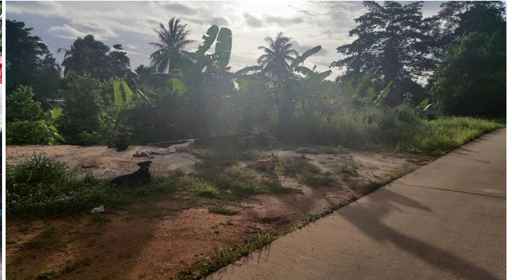
Tina ist das ganze Jahr über mit ihrem Roller unterwegs, um die vielen Schützlinge auf Koh Chang zu versorgen.

Die grosse durch die Tierbotschafter finanzierte Kastrationsaktion im Mai 2015 hat ein starkes Zeichen gesetzt auf der Insel und eine gute Basis für nachhaltige Tierschutzarbeit geschaffen. Aber es bleibt noch sehr viel zu tun...!