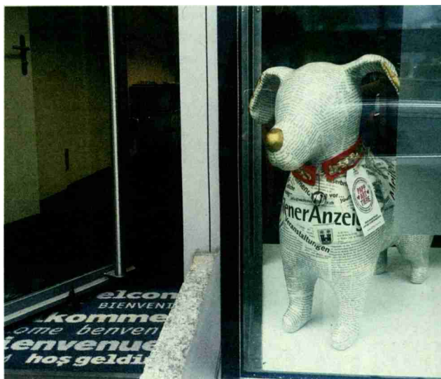
Auch der Meilener Anzeiger hat seinen PappArt-Tierfreund – er steht im Schaufenster der Redaktion an der Bahnhofstrasse 28.