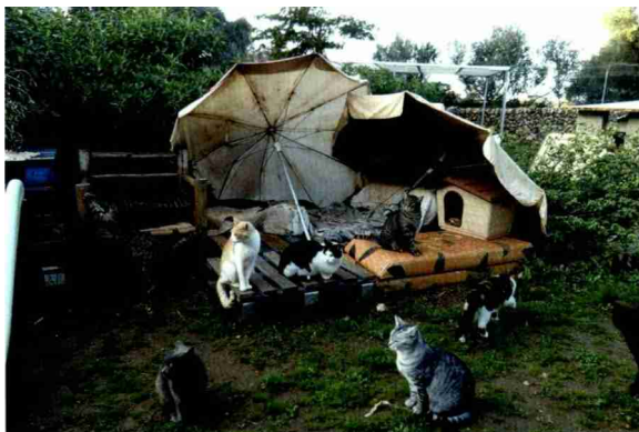
Links Die Auffangstation Tanca auf Menorca bietet circa 150 Katzen Schutz und Heimat.

Hoffnungsträger auf Mallorca ist vor allem die zunehmende Anzahl junger Leute, die sich für Tierschutzthemen zu interessieren beginnen, an den Schulen Vorträge halten und sich ganz allgemein mehr für die Umwelt und die Fauna engagieren wollen. Dennoch darf man die Augen nicht vor der Tatsache verschliessen, dass ausgerechnet auf der beliebtesten Touristeninsel nach wie vor am laufenden Band Tiere getötet werden, sei dies durch gezielte Vergiftungsaktionen oder in den Tötungsstationen. Eine solche beherbergt auch die Touristenattraktion «Natura Parc». Obwohl