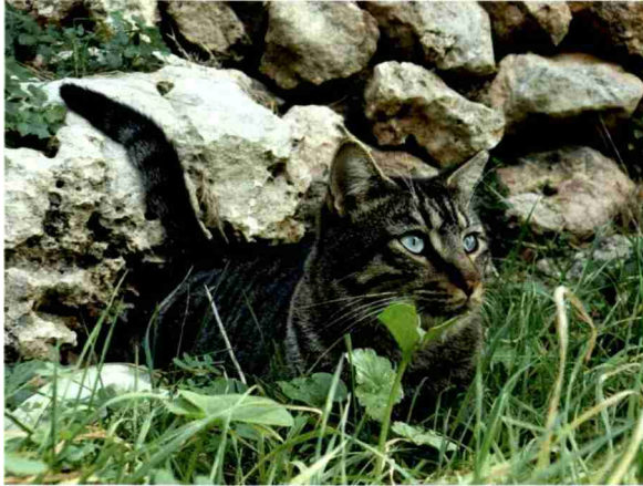
Wunderschöne Katzen landen tagtäglich auf Spaniens Strassen und brauchen Hilfe von den Tierschützern.

Themen-Nr.: 138.009 Abo-Nr.: 1074557 Seite: 28 Fläche: 209'971 mm 2