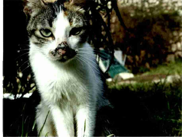
Rechts oben Strassenkatze Princess hatte Glück. Sie entschied sich, nach der Kastration zahm zu werden und zog bei einer alten spanischen Lady ein. Sie wird heute über alles geliebt.