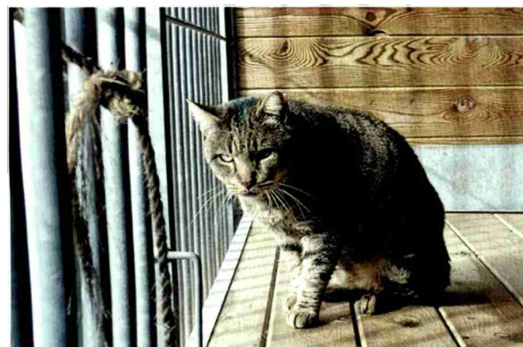
Staatliche Tierheime sind oft trostlose Betonkerker. Die Be- dürfnisse der Katzen werden ignoriert.